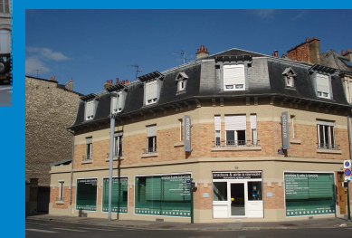
... et aujourd'hui