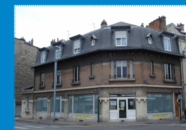
Il y a quelques mois...